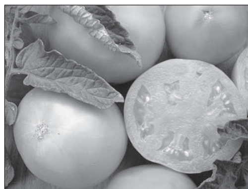
Рис. 4. Оранжево-красная мякоть плода селекционной линии № 279-05 F 4 (Барон × Dark Green) ( B, hp-2 dg )

ленной присутствием гена hp-2 dg , по сравнению с его простыми гомозиготами ( hp-2 dg /hp-2 dg ). Это способствовало повышению уровня про-