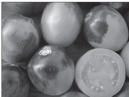
Рис. 2. Селекционная линия № 533-05 F 4 (Барон × Dark Green) ( B, hp-2 dg )