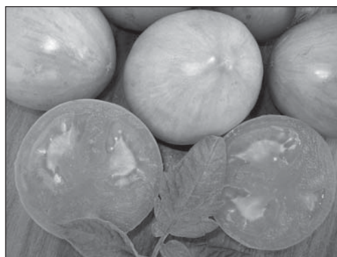
Рис. 5. Красно-оранжевая мякоть плода линии № 377-1/1 06 F 3 {[F 3 (Dark Green × Дружба) × F 4 [(Княжич × Liberator) × Мл-638]} ( B, hp-2 dg , gs, u )

дуктивности таких растений и их скороспелости (продолжительность вегетационного периода от массовых всходов до начала созревания) (табл. 1). Эффект ослабления депрессивного влияния гена hp-2 dg присутствием гена B является достаточно веским фактом, подтверждающим возможность эффективного использования генов повышенной пигментации плода в создании высококароотиновых форм томата. Возможно выявленная особенность имеет связь и с эффектом более быстрого сбраживания семян в пульпе оранжевоплодных (с геном B ) сортов. Так, в исследованиях Смаглий и др. [20] выявлено, что при сбраживании семена оранжевоплодных сортов томата начинают прорастать уже через 8 ч, тогда как у красноплодных форм прорастание начинается лишь через 25 ч. В обоих случаях имеет место сходный эффект ферментативной стимуляции ростовых процес-