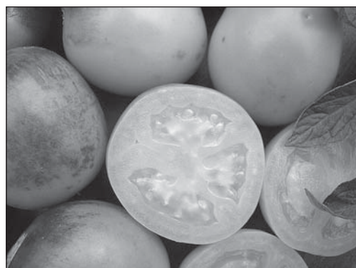
Рис. 3. Селекционная линия № 277-05 F 4 (Барон × Dark Green) ( B, hp-2 dg )

ленной присутствием гена hp-2 dg , по сравнению с его простыми гомозиготами ( hp-2 dg /hp-2 dg ). Это способствовало повышению уровня про-